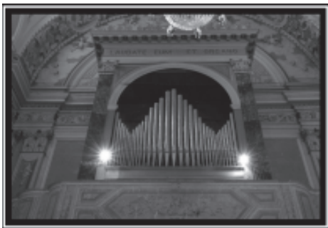
Cressa (No) - Chiesa dei Santi Giulio e Amatore Organo di A. Mentasti del 1876 restaurato nel 2006